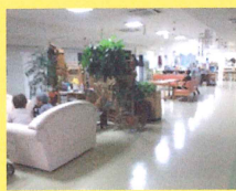
広くて明るい多目的なホール