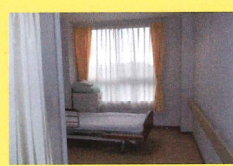
介護ベッドとナースコール備え付けの個室で安全とプライバシーに配慮された居室