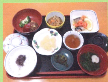
栄養バランスばっちり

入所中はかかりつけ医との関係はいったんお休みとなります。標準的な医療は施設が担当します。看護師は夜間も配置され、安心していただけます。