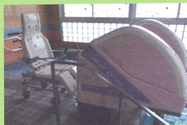
機械浴槽各階配備

機械浴槽が各階配備されており、身体機能に配慮して快適・安全に入浴介助をします。自分でできる動作は自分でするのが自立への第一歩。介護福祉士やヘルパーがあなたの日常生活を支えます。